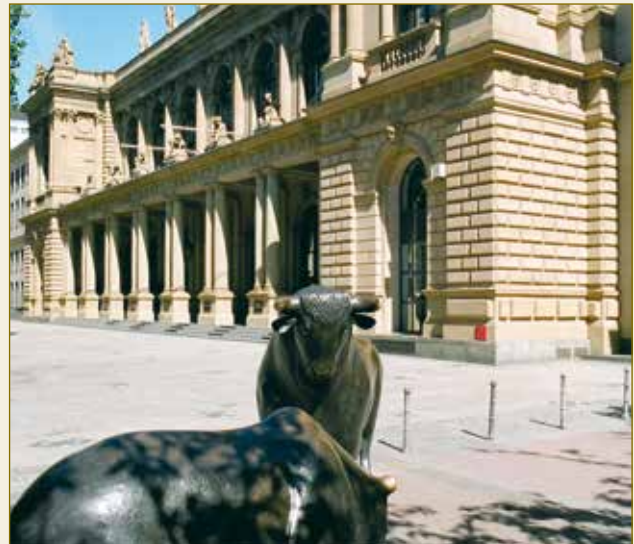
FIAC – Frankfurt International Arbitration Center in der Industrie- und Handelskammer Frankfurt.

Es steht den Parteien frei, Regeln über die Beweiserhebung zu vereinbaren oder dem Verfahren international anerkannte Regelwerke über die Beweiserhebung zu Grunde zu legen. Dem deutschen Schiedsverfahrensrecht sind zeit- und damit kosten-