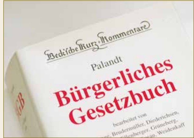
Commentaire sur le Code civil: toute la jurisprudence d'un seul coup d'œil.

Le droit allemand est calculable et fiable. Le législateur détermine la systématique et la structure, tandis que les avocats et les notaires s'occupent des cas particuliers.