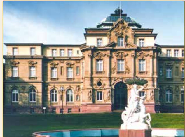
Der Bundesgerichtshof, das oberste deutsche Gericht in Zivilsachen.

Zur Berechenbarkeit deutscher Zivilprozesse trägt auch das deutsche Haftungsrecht bei. Extrem hohe Schadensersatzsummen, wie beispielsweise in den USA üblich, gibt es in Deutschland nicht. Auch der Gedanke eines „Strafschadens“ ist dem deutschen Recht, das lediglich den tatsächlich entstandenen Schaden ausgleicht, fremd. Als Unternehmen ist für Sie ein etwaiges Prozessrisiko daher sehr gut kalkulierbar .