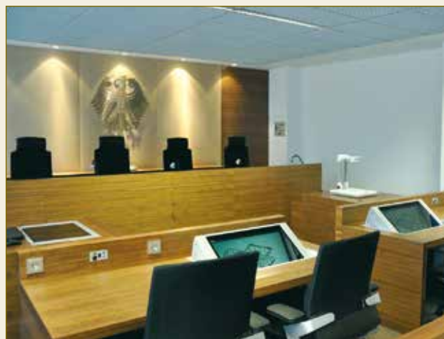
Bundespatentgericht in München.

Lors de la conduite de la procédure le tribunal veille d'abord à ce que les parties exposent leurs positions d'une manière complète et désignent leurs moyens de preuve. L'obtention de preuves proprement dite est préparée au moyen de décisions ordonnant une mesure d'instruction sur les faits nécessitant d'être éclaircis.