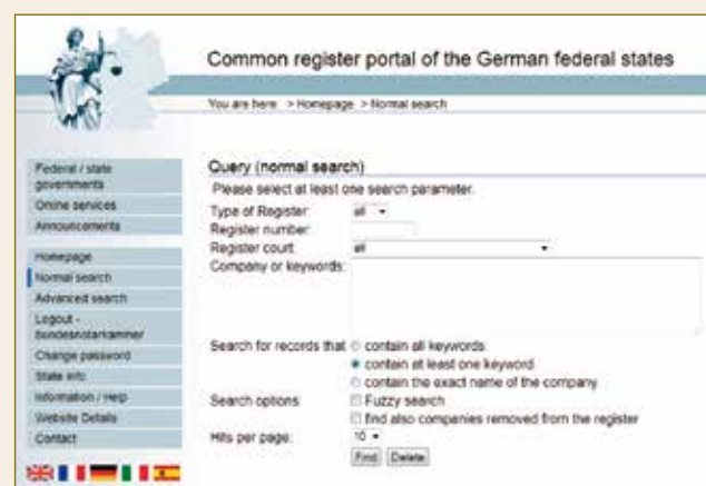
Le registre allemand du commerce et des sociétés; accessible en ligne à tout le monde ( www.handelsregister.de ).

Du fait de la sécurité du registre, des manipulations criminelles telles que les fausses inscriptions, le vol d'identité ou des faits tels que la fraude hypothécaire et « l'usurpation de domicile » qui sont à l'ordre du jour dans d'autres États industriels très développés ne sont pas imaginables en Allemagne. Personne ne doit craindre une manipulation ou un usage abusif des données figurant dans les registres judiciaires.