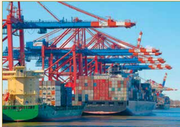
Gerade im internationalen Handel ist ein verlässliches Rechtssystem unerlässlich. Un système juridique fiable est indispensable, notamment pour le commerce international.

Sicherungseigentum und Eigentumsvorbehalt sichern den Kreditgeber, obwohl er nicht oder nicht mehr im Besitz der Sache ist. Hier zeigt sich das deutsche Recht erheblich flexibler und effizienter als andere Rechtsordnungen, die Sicherungsrechte immer vom Besitz der Sache abhängig machen.