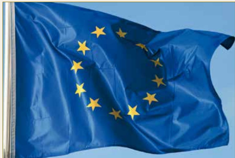
Das kontinentaleuropäische Recht – stark in Europa.

Si vous êtes entrepreneur vous avez besoin d'employés bien formés, d'une administration publique performante, d'un système éducatif qui fonctionne bien, de routes, gares et aéroports, mais avant tout également d'une infrastructure juridique qui fonctionne bien et qui soit calculable. L'Allemagne vous offre toutes ces conditions-cadres de la meilleure façon qui soit.