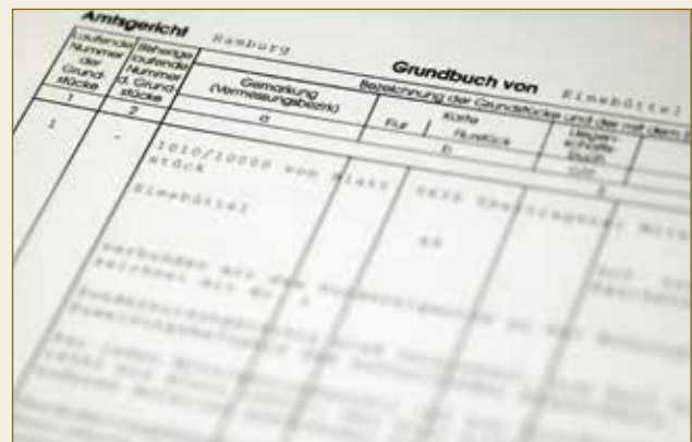
Toute information sur les propriétaires et les hypothèques de biens fonciers figurent dans le livre foncier moderne et électronique: fiable et sûr!

Enfin, par la lettre de gage la juridiction allemande met à la disposition des banques un moyen de refinancement internationalement reconnu et particulièrement sûr.