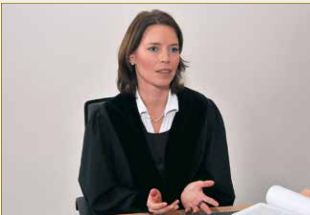
Führt durch den Prozess: die deutsche Richterin. La procédure se déroule sous la direction du juge allemand.

Deutsche Gerichte arbeiten äußerst effizient und schnell: Bei den Amtsgerichten (Streitwert bis 5.000 Euro) sind in Deutschland über 50 Prozent der Verfahren binnen drei Monaten abgeschlossen. Am Landgericht (Streitwert über 5.000 Euro) ist jedes dritte Verfahren innerhalb von drei Monaten beendet und weitere 25 Prozent nach spätestens sechs Monaten.