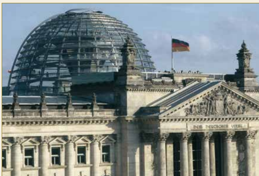
Law – Made in Germany: Der Deutsche Bundestag.

Als Unternehmer benötigen Sie gut ausgebildete Arbeitnehmer, eine leistungsstarke öffentliche Verwaltung, ein funktionierendes Bildungswesen, Straßen, Bahnhöfe und Flughäfen, vor allem aber auch eine funktionierende und berechenbare rechtliche Infrastruktur. Alle diese Rahmenbedingungen bietet Ihnen Deutschland in optimaler Weise.