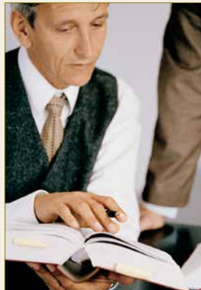
Juristes allemands: experts en rédaction de contrats.

Le droit en matière de contrats d'ouvrage explicitement réglé dans le Code civil offre aux rédacteurs de contrats des règles claires tenant compte des intérêts des parties, à partir de la passation de marchés jusqu'à la réception et de surcroît à l'égard d'éventuels