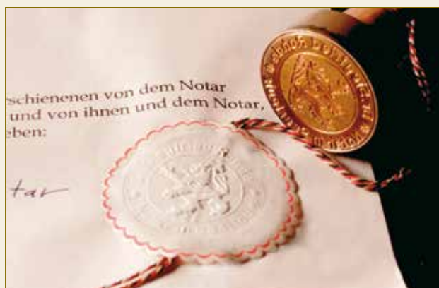
Die notarielle Urkunde: Damit kommen Sie schneller zum Ziel.

Ein Wettbewerber berichtet über angebliche Zahlungsschwierigkeiten der NRR MedTech GmbH.