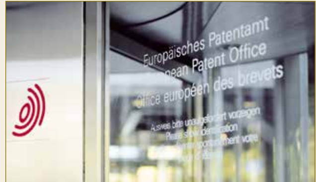
Das Europäische Patentamt in München: Hier ist Ihr geistiges Eigentum gut aufgehoben.

Diese klägerfreundliche Regelung und Handhabung zieht viele ausländische Kläger vor deutsche Gerichte. Die Kosten des deutschen Patentverfahrens sind begrenzt. Erstattungsfähig sind sie nur nach dem Streitwert mit einer Obergrenze von 30 Millionen Euro. Deutsche Gerichte sind zudem sehr zurückhaltend mit dem Ansatz hoher Streitwerte.