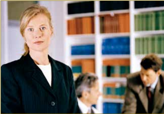
Deutsche Juristen: Experten für Vertragsgestaltung.