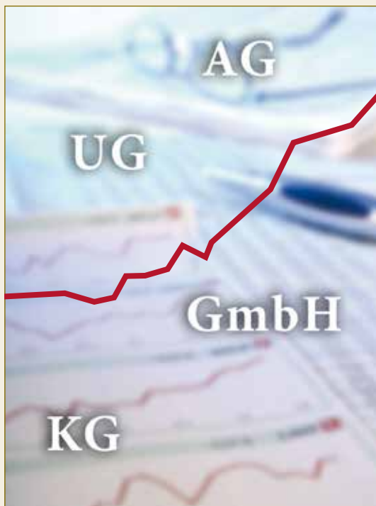
Deutsches Gesellschaftsrecht – international eine Erfolgsgeschichte. Droit allemand des sociétés – une réussite sur le plan international.

Das deutsche Handelsgesetzbuch regelt die Personenhandels-gesellschaften, von denen die Kommanditgesellschaft (KG) im Wirtschaftsverkehr am häufigsten anzutreffen ist. Insbesondere kleine und mittlere Unternehmen greifen auf diese Rechtsform zurück. Jede Kommanditgesellschaft besteht aus mindestens einem unbeschränkt haftenden Gesellschafter, der auch eine Kapitalgesellschaft sein kann, und einem oder mehreren Kommanditisten, deren Haftung auf ihre jeweilige Einlage beschränkt ist.