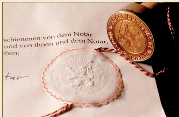
Die notarielle Urkunde: Damit kommen Sie schneller zum Ziel.

Ein Wettbewerber berichtet über angebliche Zahlungsschwierigkeiten der NRR MedTech GmbH.