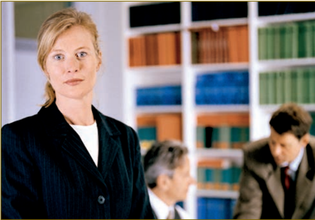
Deutsche Juristen: Experten für Vertragsgestaltung.