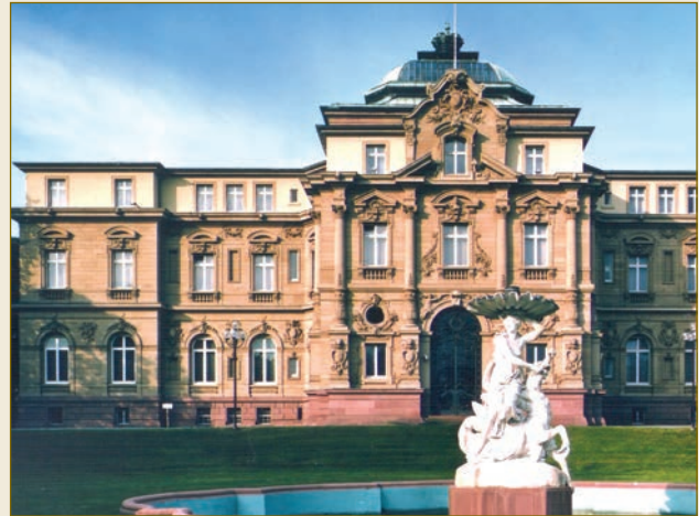
Der Bundesgerichtshof, das oberste deutsche Gericht in Zivilsachen.

Zur Berechenbarkeit deutscher Zivilprozesse trägt auch das deutsche Haftungsrecht bei. Extrem hohe Schadensersatzsummen, wie beispielsweise in den USA üblich, gibt es in Deutschland nicht. Auch der Gedanke eines „Strafschadens“ ist dem deutschen Recht, das lediglich den tatsächlich entstandenen Schaden ausgleicht, fremd. Als Unternehmen ist für Sie ein etwaiges Prozessrisiko daher sehr gut kalkulierbar .