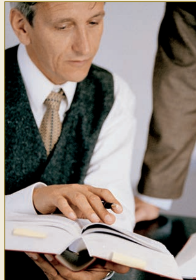
Luật gia Đức: chuyên gia xây dựng hợp đồng

Luật hợp đồng về sản xuất - được qui định đầy đủ trong Bộ Dân luật – đem lại cho người thiết lập hợp đồng những qui định rõ ràng và phù hợp với nhu cầu từ việc phát thảo cho đến việc tiếp nhận và hơn thế nữa về các thiếu sót nếu có. Một hợp đồng về sản xuất hiệu quả vì thế theo luật Đức không phải bao quát nhiều để