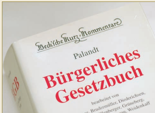
Bình luận về BGB: các phán quyết tóm gọn.

Cơ chế pháp luật Đức là một cơ chế có thể tính trước được và đáng tin cậy. Các nhà lập pháp để ra hệ thống và cơ cấu, các luật sư và công chứng viên thể hiện trong từng trường hợp một.