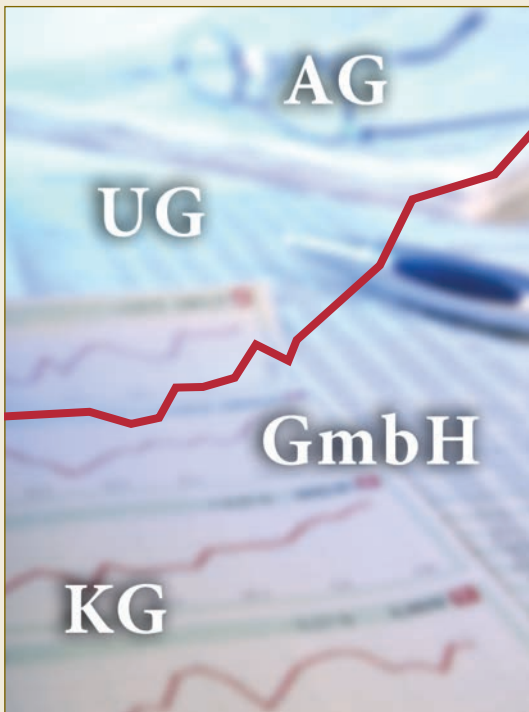
Deutsches Gesellschaftsrecht – international eine Erfolgsgeschichte. Luật công ty của Đức – một thành công đối với quốc tế.

Das deutsche Handelsgesetzbuch regelt die Personenhandels-gesellschaften, von denen die Kommanditgesellschaft (KG) im Wirtschaftsverkehr am häufigsten anzutreffen ist. Insbesondere kleine und mittlere Unternehmen greifen auf diese Rechtsform zurück. Jede Kommanditgesellschaft besteht aus mindestens einem unbeschränkt haftenden Gesellschafter, der auch eine Kapitalgesellschaft sein kann, und einem oder mehreren Kommanditisten, deren Haftung auf ihre jeweilige Einlage beschränkt ist.