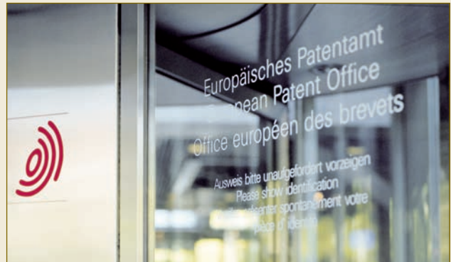
Das Europäische Patentamt in München: Hier ist Ihr geistiges Eigentum gut aufgehoben. Tổng cục Bằng Sáng chế và Nhân hiệu Âu châu ở Munich: Ở đây sở hữu trí tuệ của quý vị luôn luôn được bảo vệ.

Diese klägerfreundliche Regelung und Handhabung zieht viele ausländische Kläger vor deutsche Gerichte. Die Kosten des deutschen Patentverfahrens sind begrenzt. Erstattungsfähig sind sie nur nach dem Streitwert mit einer Obergrenze von 30 Millionen Euro. Deutsche Gerichte sind zudem sehr zurückhaltend mit dem Ansatz hoher Streitwerte.