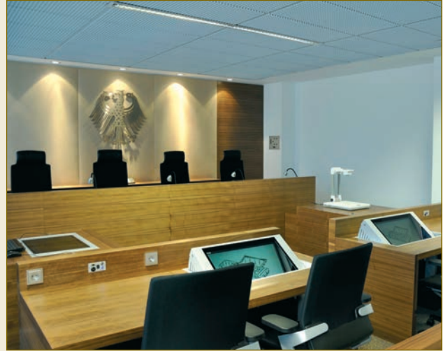
Bundespatentgericht in München.

Các qui định về chứng cứ được cân bằng một cách cẩn thận và phân chia hợp lý gánh nặng này cho cả hai bên. Trên nguyên tắc thì mỗi bên phải chứng minh các chi tiết có lợi cho mình. Ở Đức