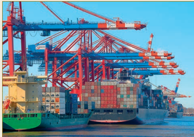
Gerade im internationalen Handel ist ein verlässliches Rechtssystem unerlässlich. Chính trong quan hệ thương mại quốc tế thì một cơ chế pháp luật đáng tin cậy là rất cần thiết.

Sicherungseigentum und Eigentumsvorbehalt sichern den Kreditgeber, obwohl er nicht oder nicht mehr im Besitz der Sache ist. Hier zeigt sich das deutsche Recht erheblich flexibler und effizienter als andere Rechtsordnungen, die Sicherungsrechte immer vom Besitz der Sache abhängig machen.