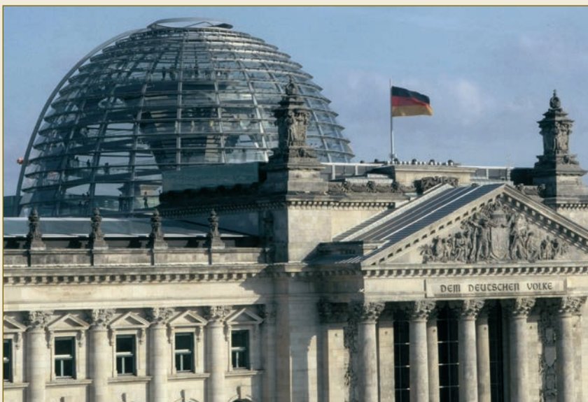
Law – Made in Germany: Der Deutsche Bundestag.

Als Unternehmer benötigen Sie gut ausgebildete Arbeitnehmer, eine leistungsstarke öffentliche Verwaltung, ein funktionierendes Bildungswesen, Straßen, Bahnhöfe und Flughäfen, vor allem aber auch eine funktionierende und berechenbare rechtliche Infrastruktur. Alle diese Rahmenbedingungen bietet Ihnen Deutschland in optimaler Weise.