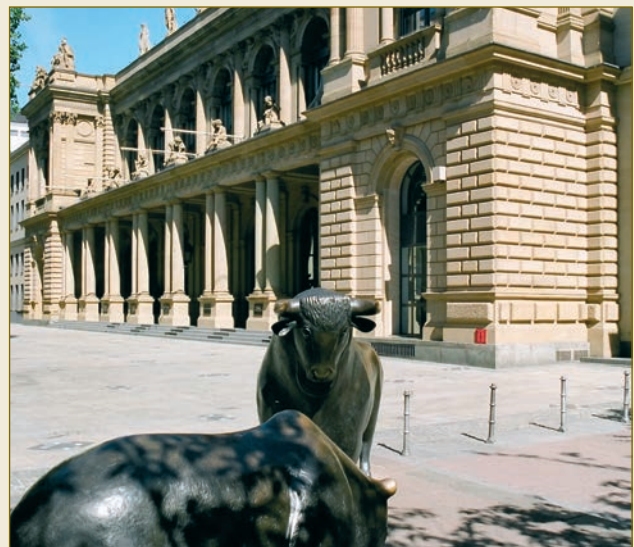
FIAC – Frankfurt International Arbitration Center in der Industrie- und Handelskammer Frankfurt.

Es steht den Parteien frei, Regeln über die Beweiserhebung zu vereinbaren oder dem Verfahren international anerkannte Regelwerke über die Beweiserhebung zu Grunde zu legen. Dem deutschen Schiedsverfahrensrecht sind zeit- und damit kosten-